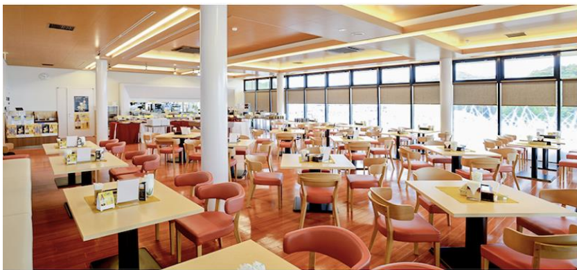
丹波里山レストラン Bonchi